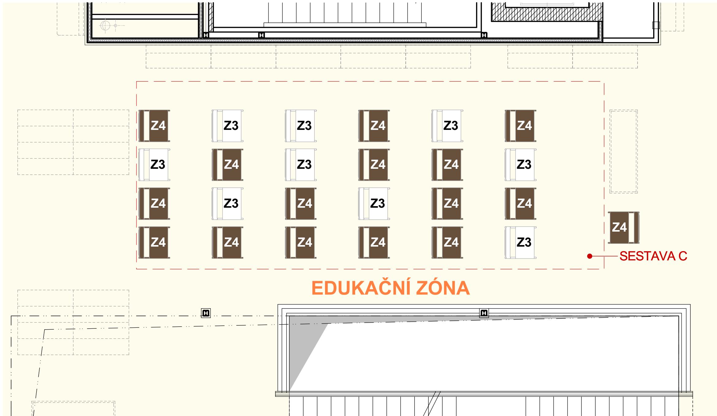
VARIANTNÍ USPOŘÁDÁNÍ SESTAVY C